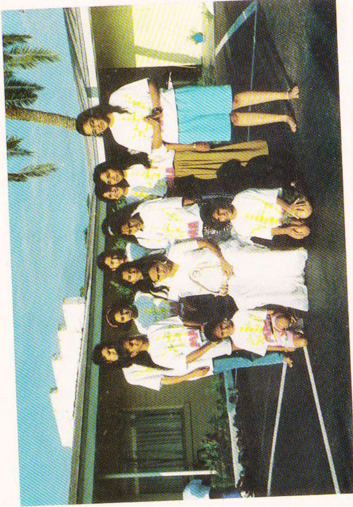
પૂ. મા સર્વેશ્વરી વિદ્યાર્થી બહેનો સાથે