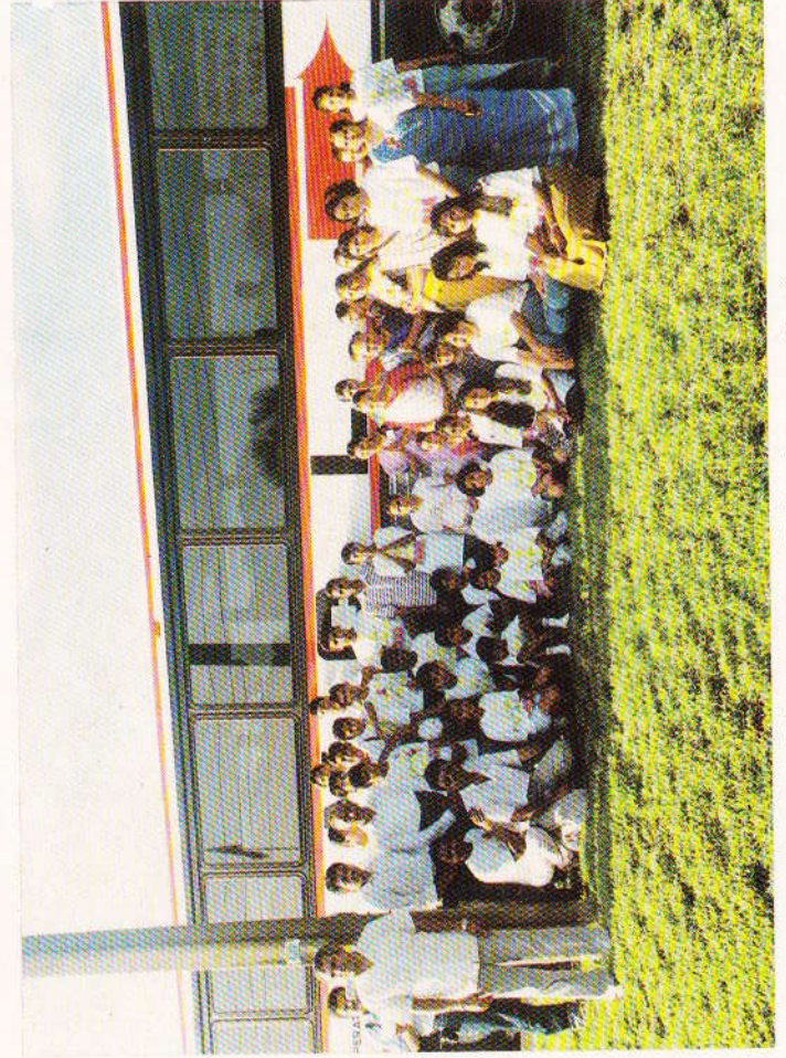
ફલોરીડા યાત્રાના યાત્રીઓ સાથે પૂ. મા સર્વેશ્વરી