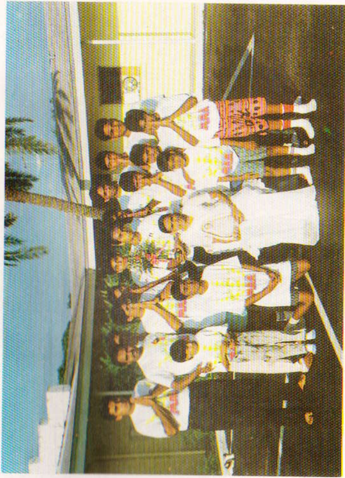
ફલોરીડા યાત્રામાં કેમ્પીંગમાં યુવકોતથા વિદ્યાર્થીઓ સાથે પૂ. મા સર્વેશ્વરી