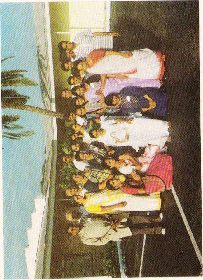
ફલોરીડા કેમ્પીંગમાં વાલીઓ સાથે પૂ. મા સર્વેશ્વરી