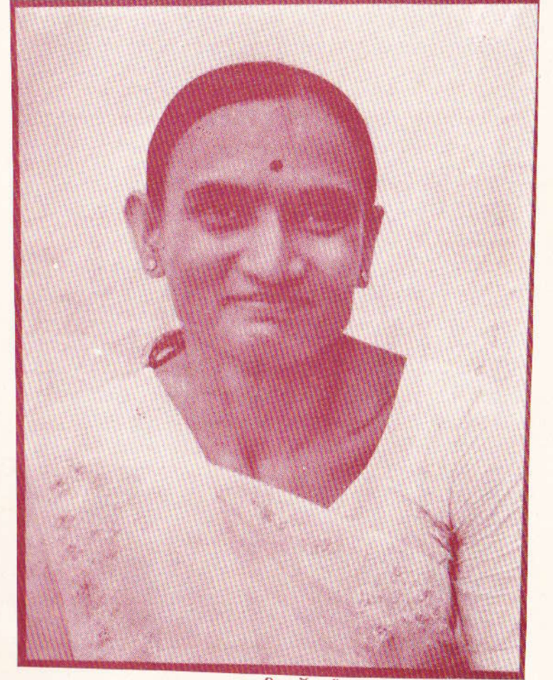
મા શ્રી સર્વેશ્વરી