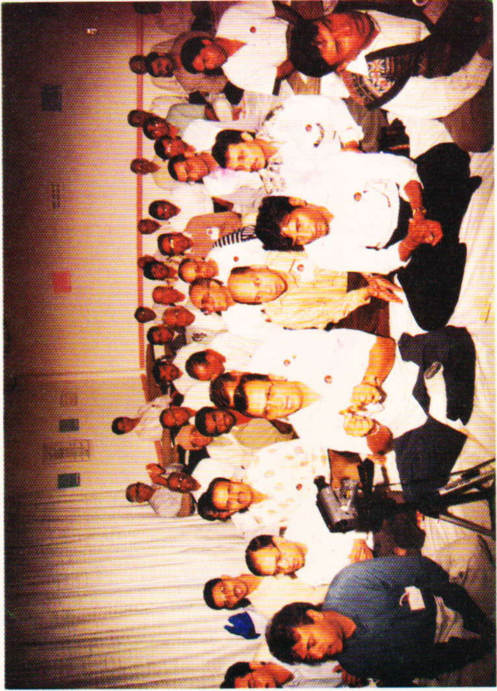
શિબિરાર્થી ભાઈઓ હોલમાં