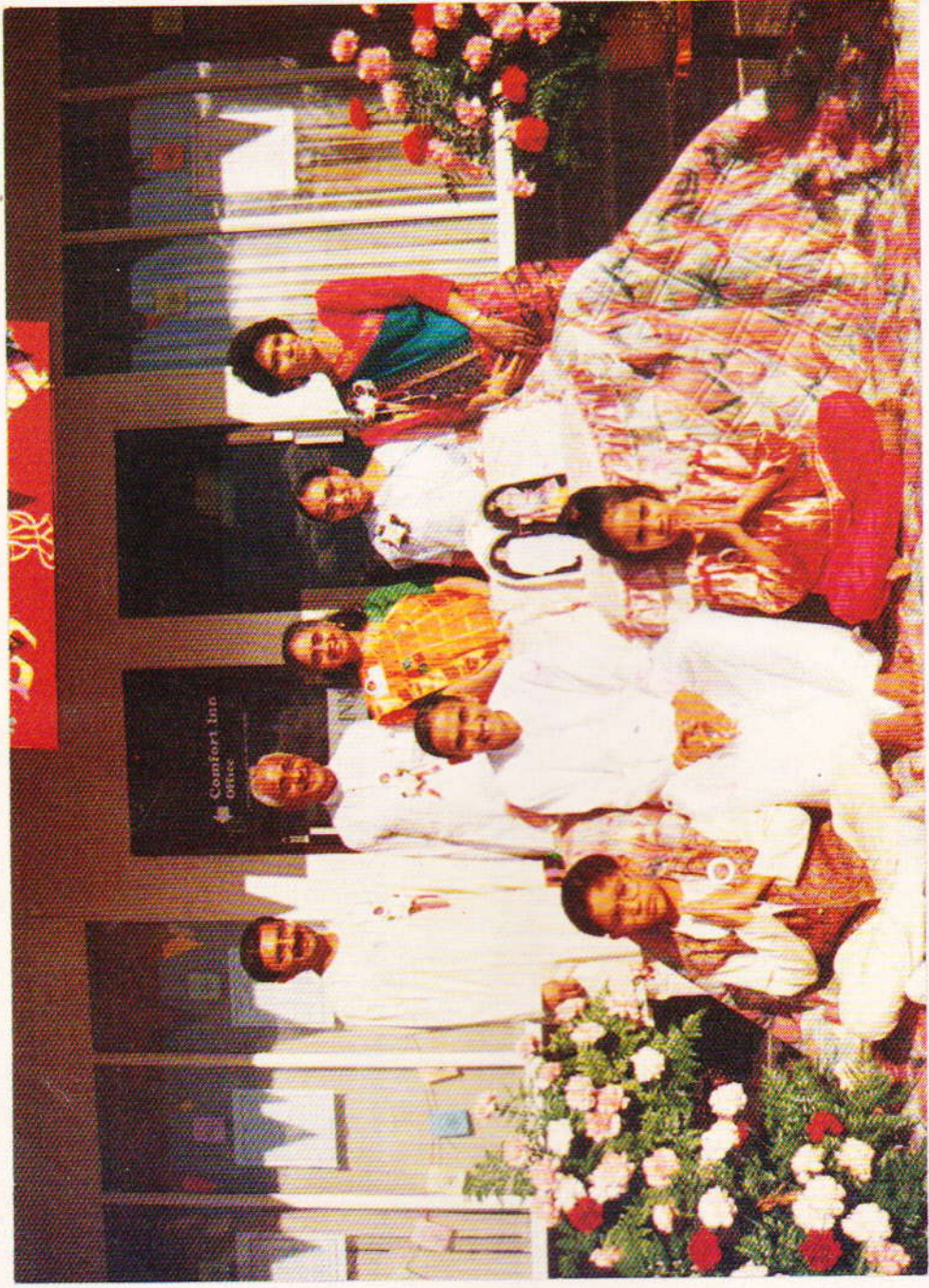
यजमान परिवार साथे पू.भा पार्थ - पूज(नीचे)