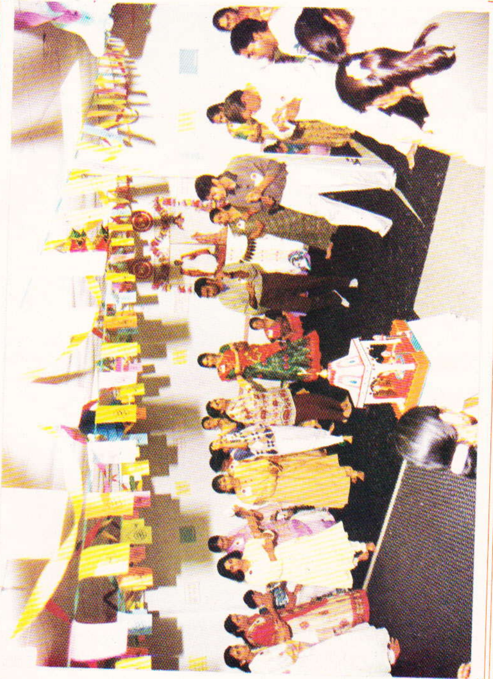
ગારબાનું એક દશ્ય