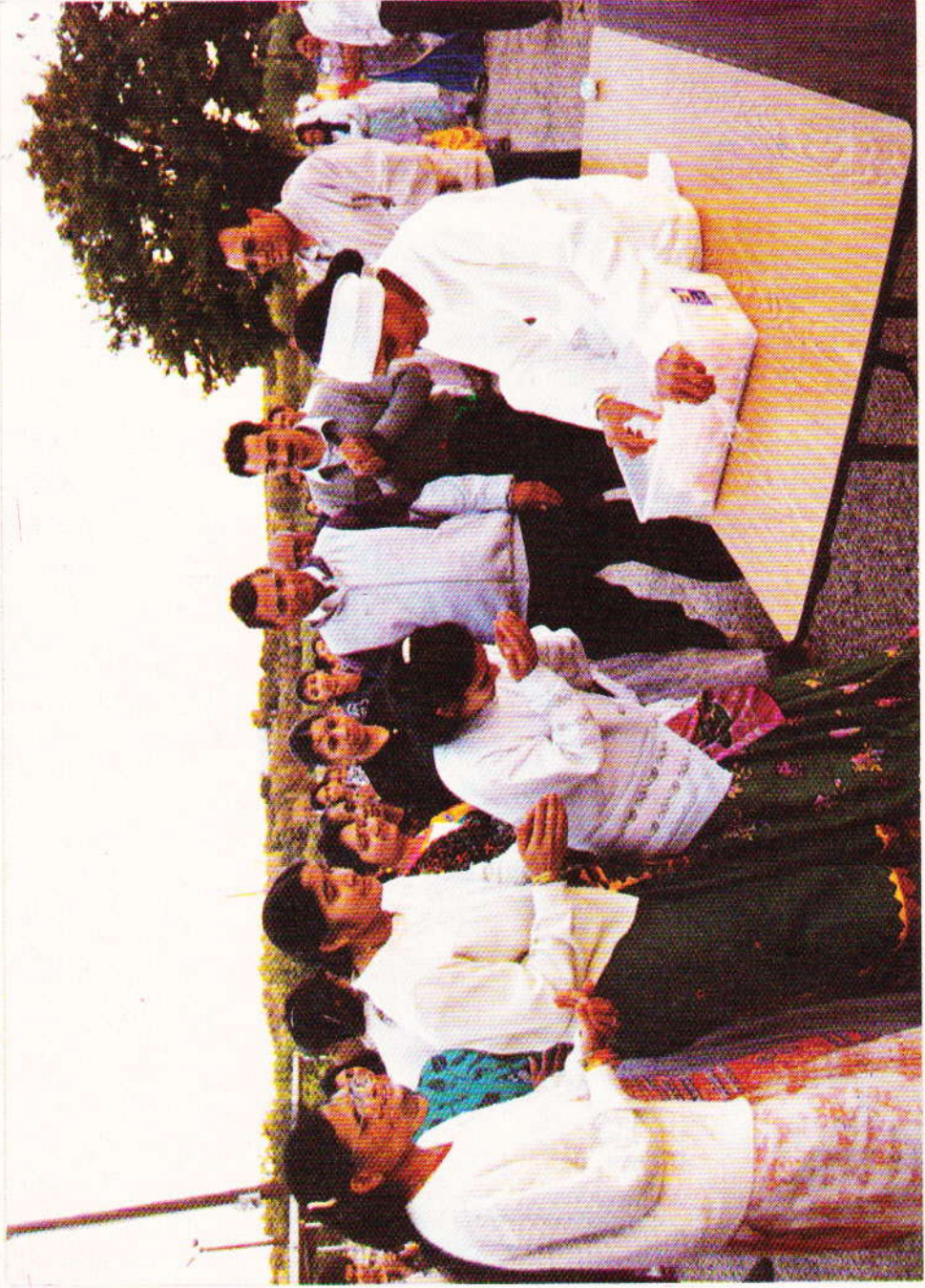
દરરોજ સવારે કસરત પછી પ્રસાદ વિતરણ