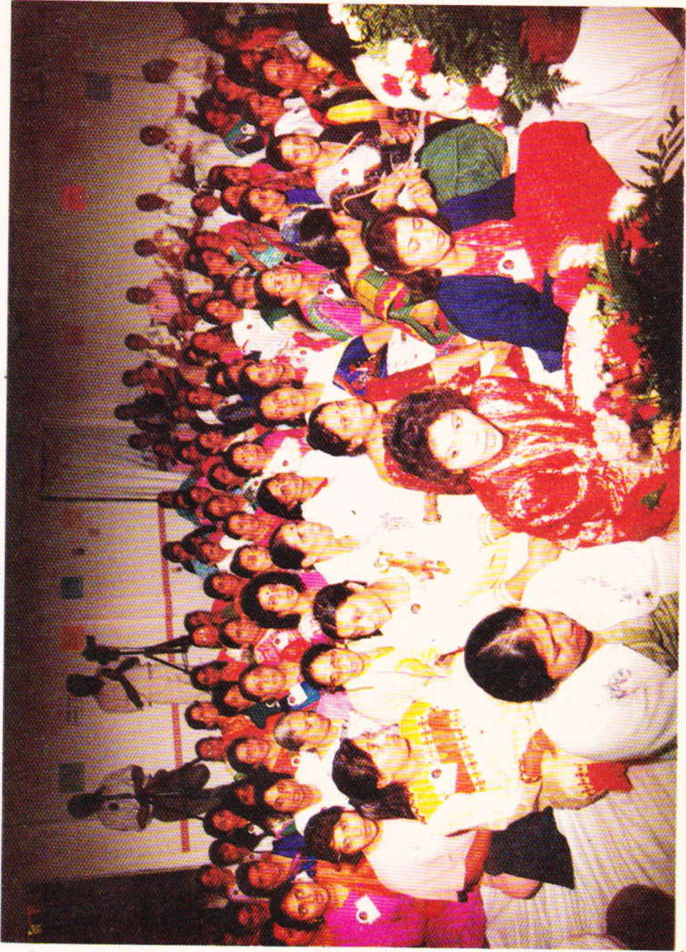
શિબિરાર્થી બહેનો હોલમાં