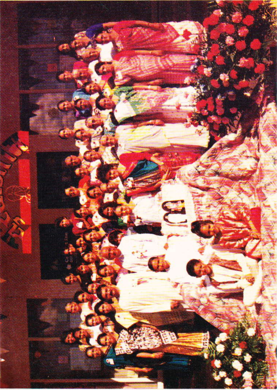
કેલીકોનીયા યુ પ-બહેનોનું