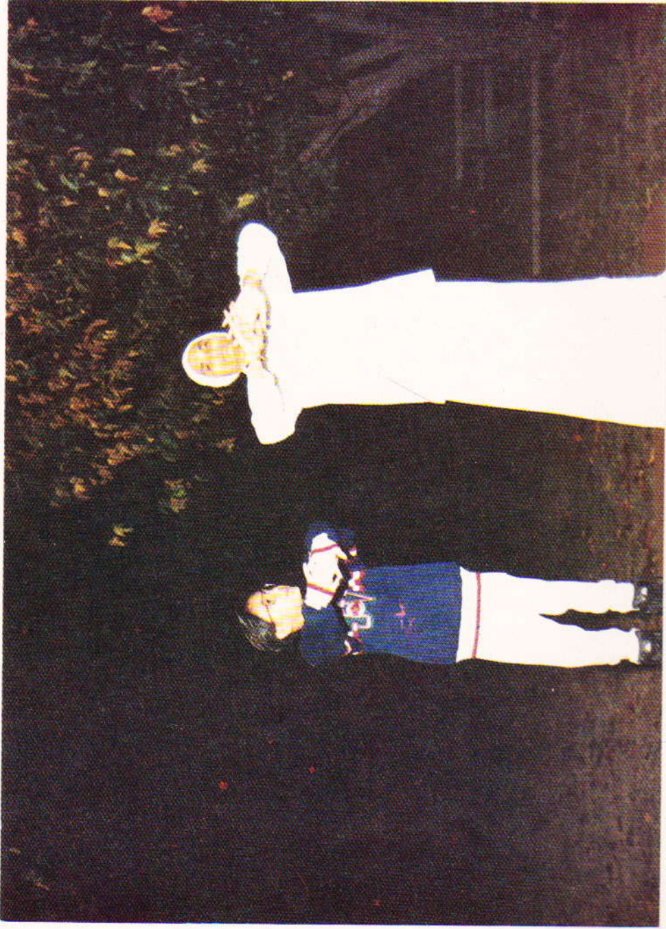
પ્રભાતે બાગમાં સમુહ કસરત પૂ. મા સાથે બાળ પાર્થ