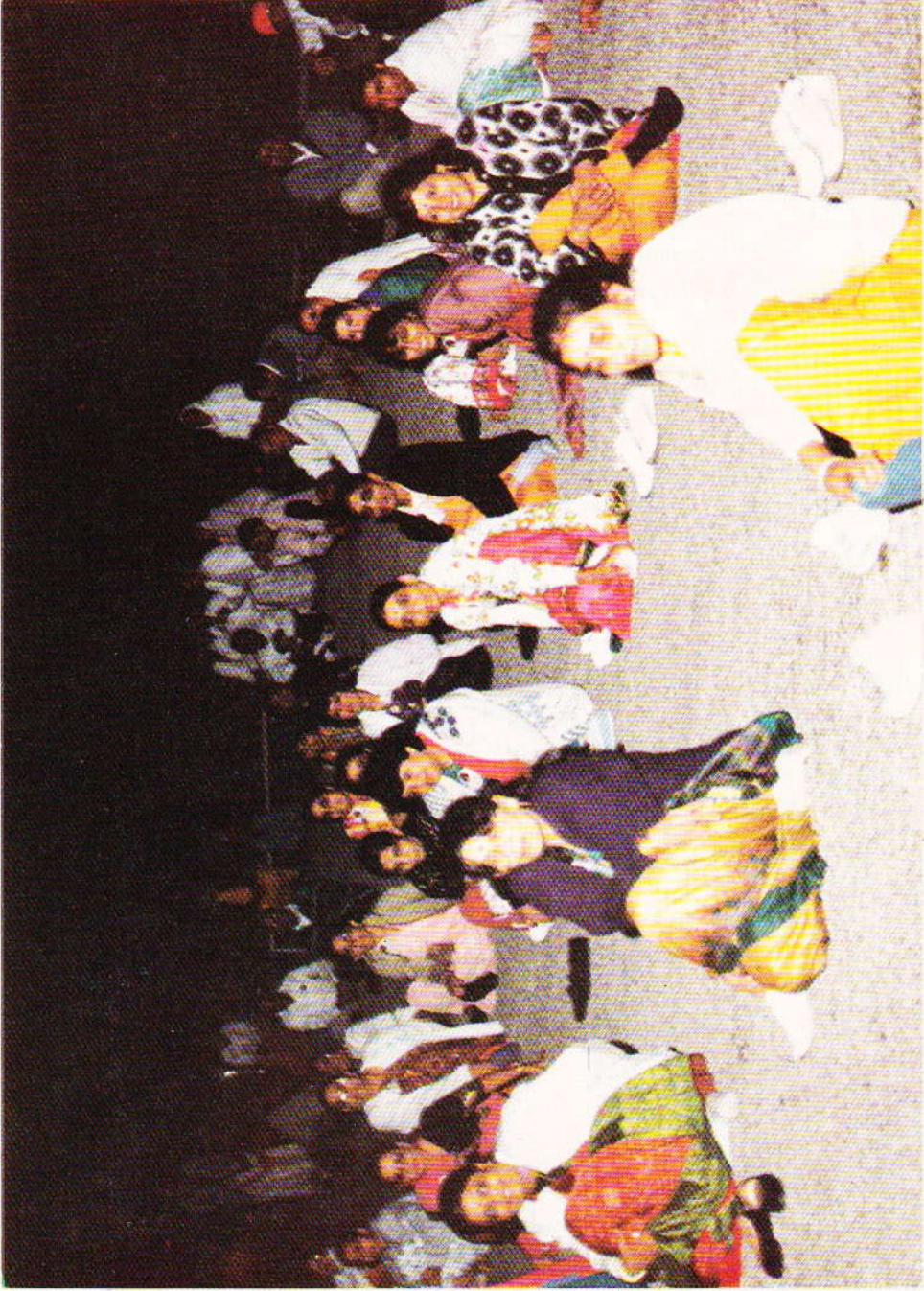
પ્રભાતે બાગમાં આસનોનું એક દશ્ય