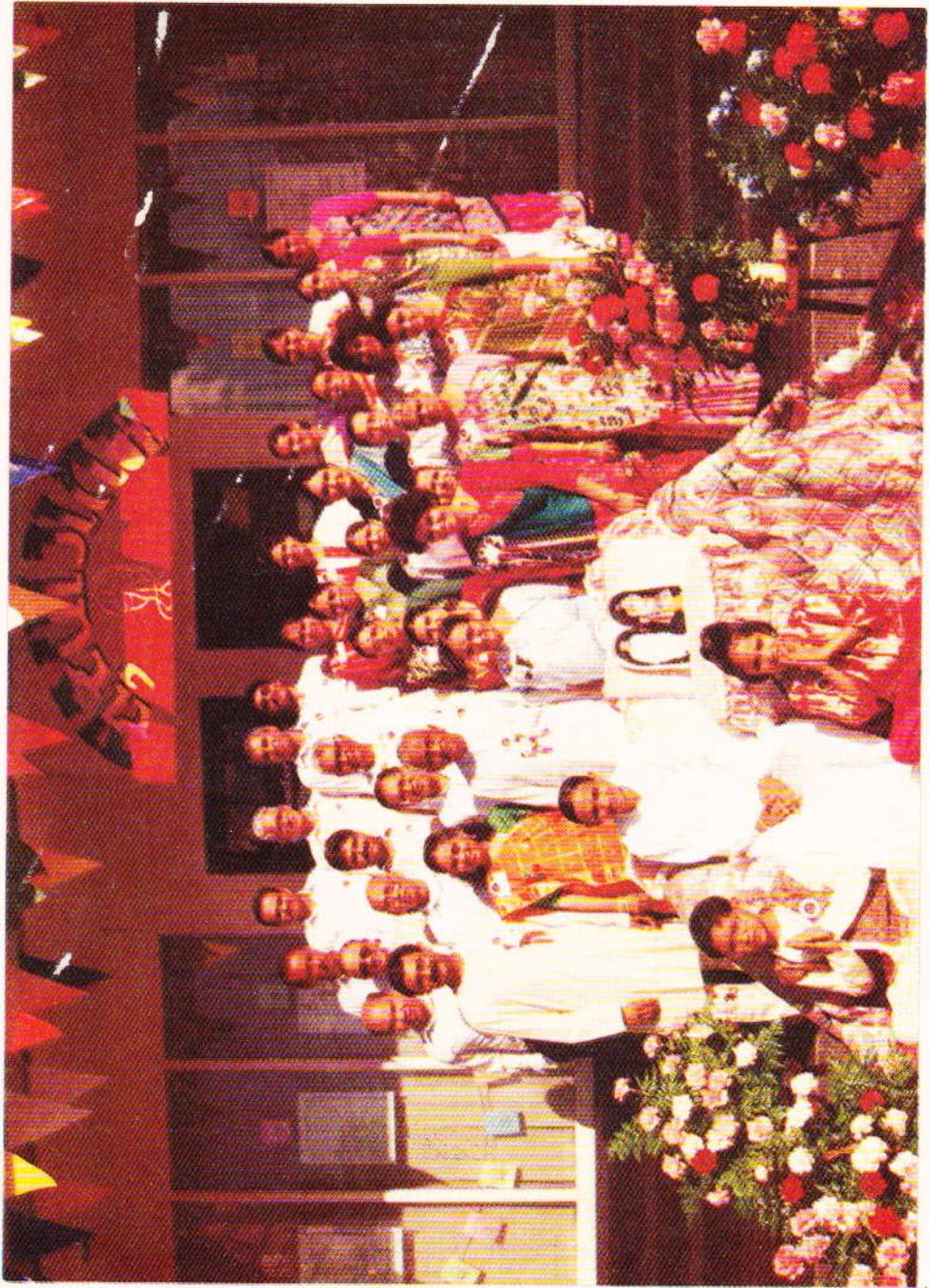
ਹ ਨਿ ਪੁਸਤਕ ਨਿ